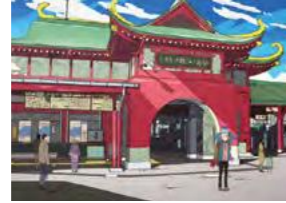
藤沢市観光協会 制作「藤沢・湘南ロケ地MAP」参照

TVアニメ『つり球』 ハルが初めて江の島の地に降り立ったのは、竜宮城を模したデザインの小田急片瀬江ノ島駅。作品のキービジュアルに使われた江の島弁天橋をはじめ、江の島各所が登場している。